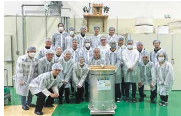
組合員さんが参加 大人21名