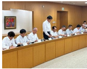
太田市長に提出した 令和8年度に向けた 政策要望書 の 一部を紹介します。