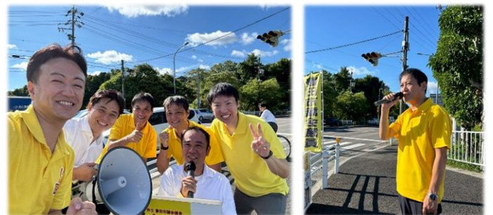
阿部県議・トヨタ労組執行委員の皆さん と街頭を行いました！