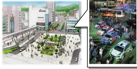
市の魅力向上に向け、整備される 豊田市駅 東口広場 に ラリーの見せる化 をすることを要望。