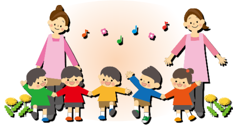
保育士の確保と離職を防止するため、 業務を サポートするフリー保育士の配置拡充 を要望。