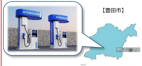
FCVの利用促進など水素需要を増やすために 産業振興エリア内へ水素ステーションを誘致 することを要望。