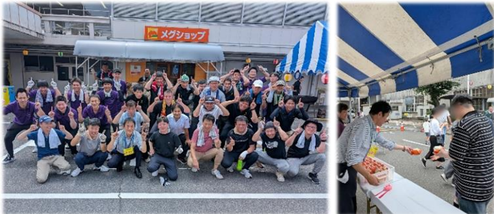
トヨタ労組 元町支部が行った メロンパンの配布 を手伝いました！