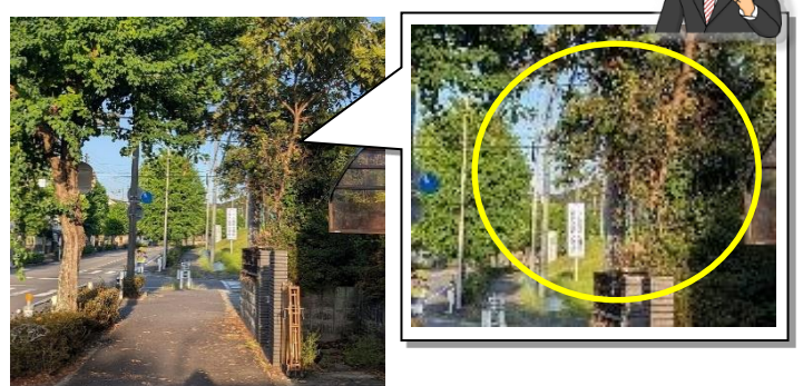
民地の場合、 市が直接伐採することができない ため、道路維持課から 空き家 所有者へ通知 をしていただき、 枝の剪定 ができました。